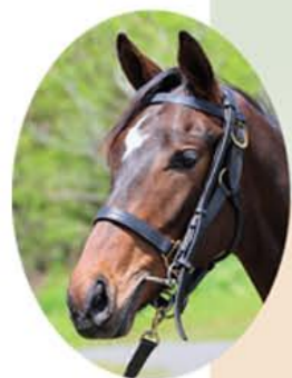
Sinister Minister *シニスターミニスター 鹿 2003